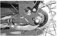
Drei-Gang-Nabenschaltung mit Bremsarmbefestigung am Rahmen

Bei Rücktrittbremsnaben ist die Bremse für das Hinterrad in der Nabe eingebaut. Diese Art der Bremse ist äußerst zuverlässig und weitgehend wartungsfrei. In der Regel werden Cityräder mit einer V-Bremse am Vorderrad und einer Rücktrittbremsnabe am Hinterrad ausgestattet. Es ist jedoch auch eine Kombination von zwei V-Bremsen und einer Rücktrittbremsnabe möglich.