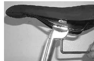
Patentsattelstütze mit Inbussbefestigung

Viele Sattelstützen werden heute mittels eines Schnellspannverschlusses befestigt. Durch Umliegen des Spannhebels können Sie die Sattelstütze lösen und herausziehen. Statt eines Schnellspanners kann die Sattelstütze an der Sattelrohrmuffe auch mittels einer Inbusschraube geklemmt werden. An Patent-Sattelstützen befindet sich eine Inbusschraube, mit der Sie die Neigung und Position (vor oder zurück) einstellen können. Nach erfolgter Einstellung die Inbusschraube mit einem geeignetem Inbusschlüssel wieder fest anziehen. Die optimale Sattelleigung hängt vom individuellen Empfinden ab. In der Regel sollte der Sattel waagrecht eingestellt sein, um Arme und Handgelenke zu entlasten.